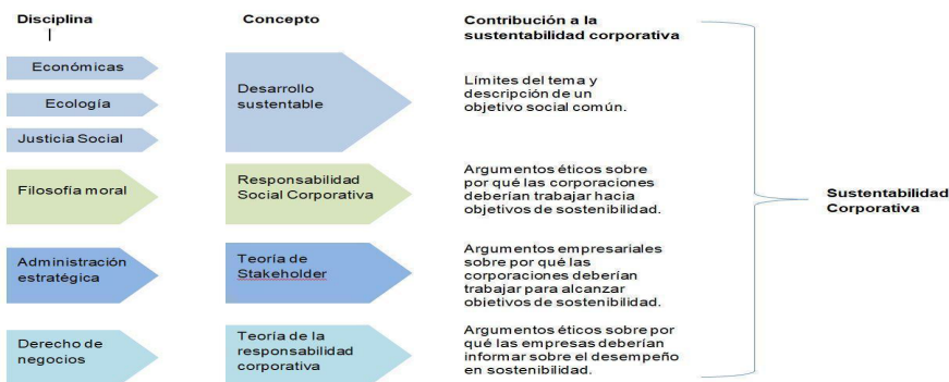
Figura 1. Evolución de la sustentabilidad corporativa

Las contribuciones de estos cuatro conceptos construyen lo que es la sustentabilidad corporativa, se muestran en la figura 1, a continuación.